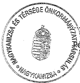
Vlasicsné Fischl Tímea Pénzügyi Bizottság elnöke